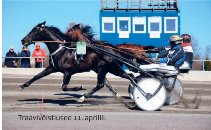
Traavivõistlused 11. aprillil.

„Esimene start on võistlustel alati kell 13, publikule avame väravad 12.30. Startide vahe on pool tundi,“ selgitab tegevjuht. „Kultuuriprogrammiga päevadel