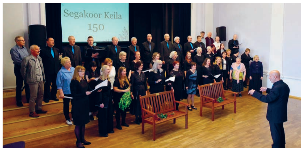
„Tuljaku“ ajaks kutsuti lavale ka endised lauljad. Koor kasvas peaaegu poolesajaliikmeliseks. Kontserdi lõpetas laulupidude armastatud pala, Peep Sarapiku „Ta lendab mesipuu poole“.