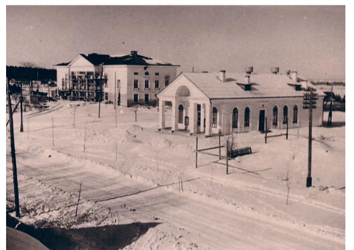
Esiplaaniil kino Saluut, taga valmiv agro-zoo propaganda maja, millest sai Keila kultuurimaja.

Keila kino tunnistati 1951. aastal vabariigi parimaks kinoks. 1951. aasta augustis linastus Keilas esimene Eesti värvifilm „Valgus Koordis“. Ajalehes kirjutati siis: „Kuna väike kinosaal ei suutnud esietenduse päeval 29. augustil kõiki kinokülastajaid, keda oli saanud veoautodel ka Harju rajooni kolhoosidest, mahutada, siis korraldati hilisõhtul veel vabaõhuseans Keila lauluväljakul. Ka järgmisel päeval jätkusid „Valgus Koordis“ etendused suure eduga, kusjuures jällegi kujunes rahvarikkaimaks vabaõhuseans Keila kultuuripargi põliste mändide all. Kahe päeva jooksul vaatas Keilas seda filmi üle 1200 inimese. Nii suurt huvi pole Keilas tuntud veel ühegi filmi üle...“ ( Bolševistlik Sõna, 1. september 1951 )