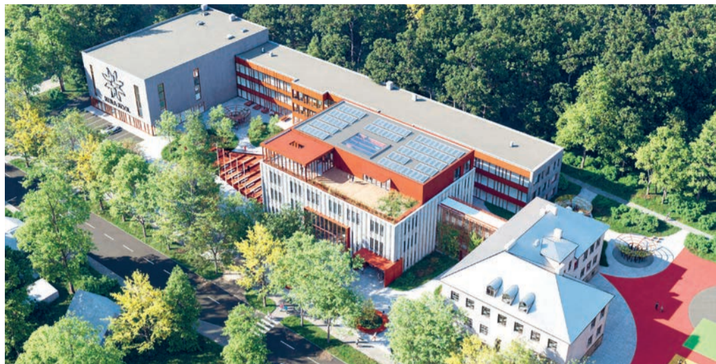
JOONIS: MOLUMBA OÜ

See puudutab kõige enam 2. klasside õpilasi, kuid ka teisi algklasse. Alljärgnevalt selgitame projekti kulgu ning millised muudatused koolikorralduses on kavandamisel.