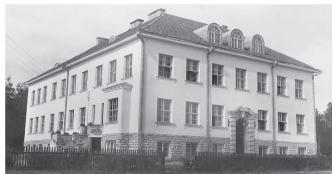
Pildiallkiri: Keila koolimajja jäi raamatukogu kuni 1948. aastani.

Arnold Kaldma määrati ametlikult raamatukogu juhatajaks 1944. aasta 1. novembrist. 5. detsembril 1944 maksti talle raamatukogutöö vajaminevateks kulutusteks avantsi 852 rubla 20 kopikat.