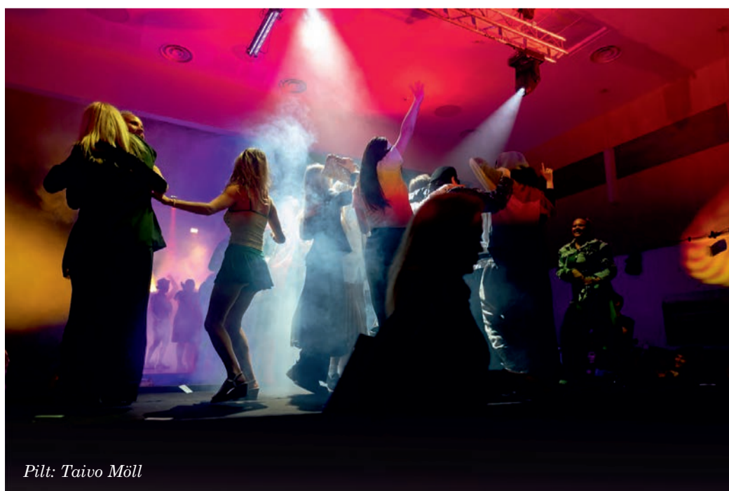
Pilt: Taivo Möll

Aitäh ka kõigile, kes vaatama ja kaasa elama tulid!