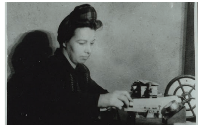
Telegrafist morseaparaadiga töötamas.

Rinde lähenemisega sõitsid siit läbi rongid evakueeritutega Haapsalu poole. Sõitis Tartu-Petseri liinilt jaamaülemaid ja korraldajaid meie jaama, kus nad mõne aja peatusid ja ei tea kuhu edasi läksid. Ei olnud ju meie jaamas neile kõigile tööd anda. Veeti juute rongiga Kloogale ja tagasi Kloogalt. Kord valgustas suur säraküünal Keila jaama, mille valgus oli nii tugev, et peaaegu võisid nõela maast üles võtta. Kes tahtis varjendisse minna, ei julgenud seda teha ja surus ennast tugevasti vastu jaama seina.