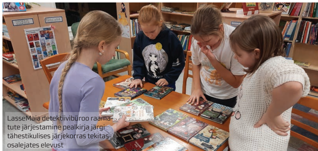
LasseMaia detektiivibüroo raamatute järjestamine pealkirja järgi tähestikulises järjekorras tekitas osalejates elevust

ma, aga läheb teisiti. Juhataja karje on kõrvulukustav. Keegi on sisse vehkinud kaks hinnalist maali. Külastajad jäävad rahulikuks ning hakkavad kiiruga lahendamata salakirja, et leida üles hinnalised kunstiteosed.