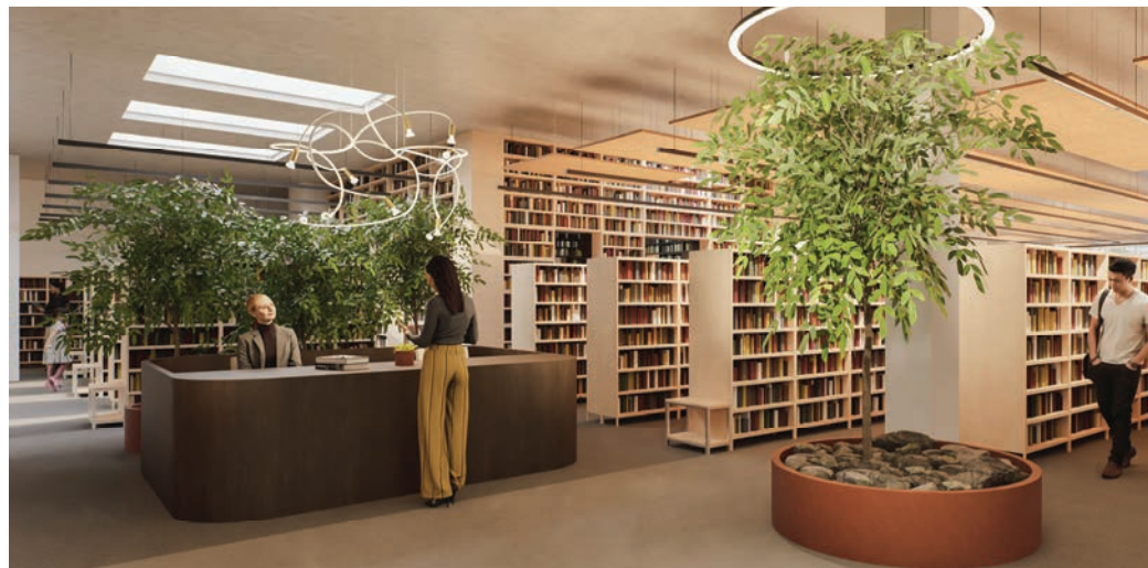
LUMIA OÜ 3D VISUAALID

Ideekonkursi läbiviimiseks saime toetust Kultuuriministeeriumi rahvaraamatukogude kiirendist. Eelmisel nädalal tuli ka otsus järgnevate projektierimistööde toetamise kohta samast allikast. Saame astuda järgmise sammu, et raamatukogu saaks olla tõeliselt tänapäevane ja mitmeti kasutatav avalik ruum, kus igaüks endale kohti ja tegevuse leiab. Kes tahab ise me unistustele pilgu