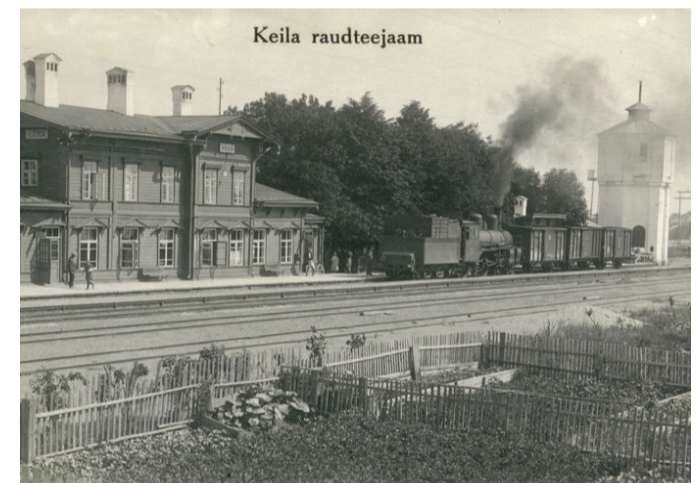
Jaamatöötajate aiamaad üle raudtee. Postkaart Harjumaa Muuseumi fotokogust

Jaaama töötajad elasid jaama territooriumil asuvates hoonetes. Korteri oli neil tasuta. Jaamaülemal oli neljatoaline korter ühes köögi ja esikuga jaamahoone ülemisel korrusel. Selle sama koridori peal oli veel üks korter – imetilluke tuba sama väikese köögi. Selles korteris elasid vahel kaubandusametnik, mõnikord telegrafist või koristaja ning ka pöormeseadja, kellele ruumi vaja läks. Jaamaülema abil oli kasarmus, s.t töötajate majas kahtoaline korter ning teemeistri kolmetoaline koos köögi. Üks tuba nendest kolmest jäi teemeistri kantseleiks ja mõne aja pärast ehitati teemeistri, kelle perekond oli suurenenud, veel kaks tuba juurde. Ülejäänud kolm või neli ühetoalist korterit kuulusid pöormeseadjatele. Jaamaülema, tema abi ja teemeistri korterid olid varustatud veevärgiga, pöormeseadjail tuli vett hoovist veekraanist tuua. Kasarmu hoovipealseteks hooneteks olid puukuurid ja käimlad kogu selle maja elanikele. Õues oli veel prügikast ja mustaveerest. Kõigil jaama töötajatel olid peenramaad ja kartulimaa raudtee taga. Jaamaülema ja teemeistri aiad kasarmu juures kasvasid õunapuud, marjapõõsad ja lilled. Peeti kanu, sigu ja kes lehma pidas, neile anti ka heinamaad. Loomalaudad paiknesid ka teisel pool raudteed.