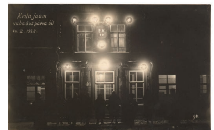
Tuledesäras jaamahoone Eesti Vabariigi 10. aastapäeval.

Alevirahvale oli rongide saabumine meeldivaks meelelahutuseks. Öhtuste rongide ajaks ja pühapäeviti kogunes jaama palju rahvast. Noored jalutasid edasi-tagasi jaama platvormil ning ka vanem rahvas uudistas saabujaid ja minejaid. Mis selles väikeses kohakeses siis ka muud vaadata oli kui ronge jaamas ja kirikurahvast kiriku juures ning sündmusi kirikus.