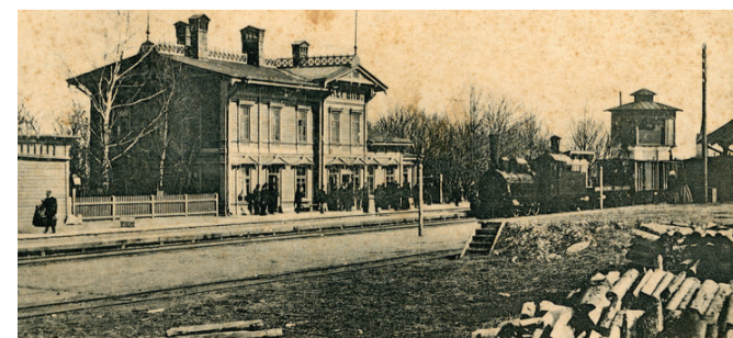
Keila rongijaam 20. sajandi alguses. Siin on veetorn veel oma algse kujul.

Pärast 1965. aastat on hoone eksterjöör ja interjöör püsinud muutumatult. Ehkki veepaaki ümbritsev tellisesein mõjub kohmaka lisandina algse sihvaka torni peal, on sellestki ehitusetapist säilinud olulisi ajastu arhitektuurile ja ehitusstiilile omaseid väärtuslikke detaile, näiteks monoliitbetoonist vahelagi ja telkkatus.