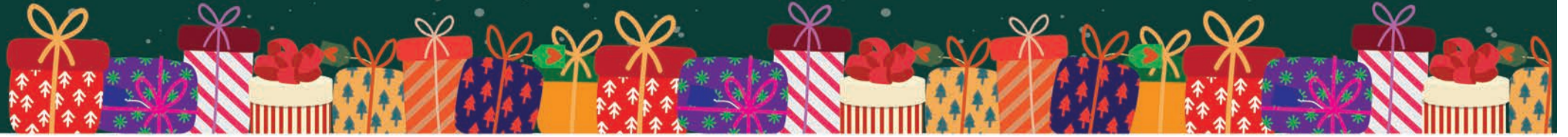
Legod alates 4.90