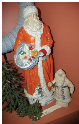
► Näärivanad 1980-ndatest.

toodangut kui ka isetehtut,“ arvab koguhoidja. Valik ning palett oleksid ju laiad ning ajastudki erinevad. Alates plekist või plas-