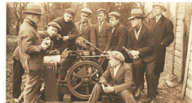
Mootoriõpetuse tund põllutöökoolis.