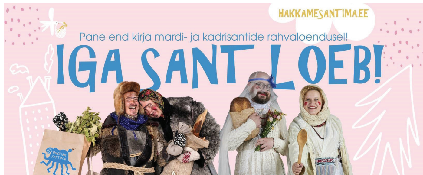
VISUAAL: EESTI FOLKLOORINÕUKOGU