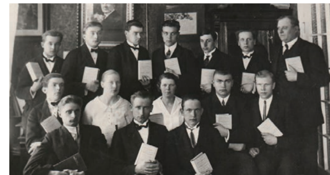
Eesti Baptisti Jutlustajate Seminari II lend.