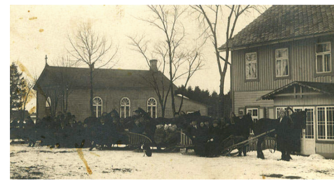
Eesti Baptisti Jutlustajate Seminari väljasõit Harku vanglasse ja alaealiste kolooniasse 1926. aastal.