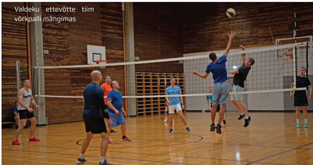
Valdeku ettevõtte tiim võrkpalli mängimas

Keila linnas on küll suurepäraseid sportimisvõimalused, ent ettevõtteiksi saab liikumist edendada. See nõuab vaid ettevõtlikkust ja eestvedajaid.