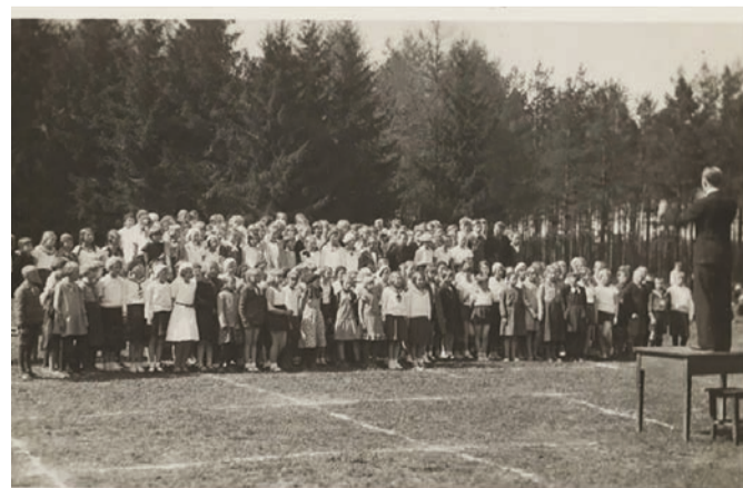
Saue ja Keila valdade lastepidu 28. mail 1933 Keila männikus.