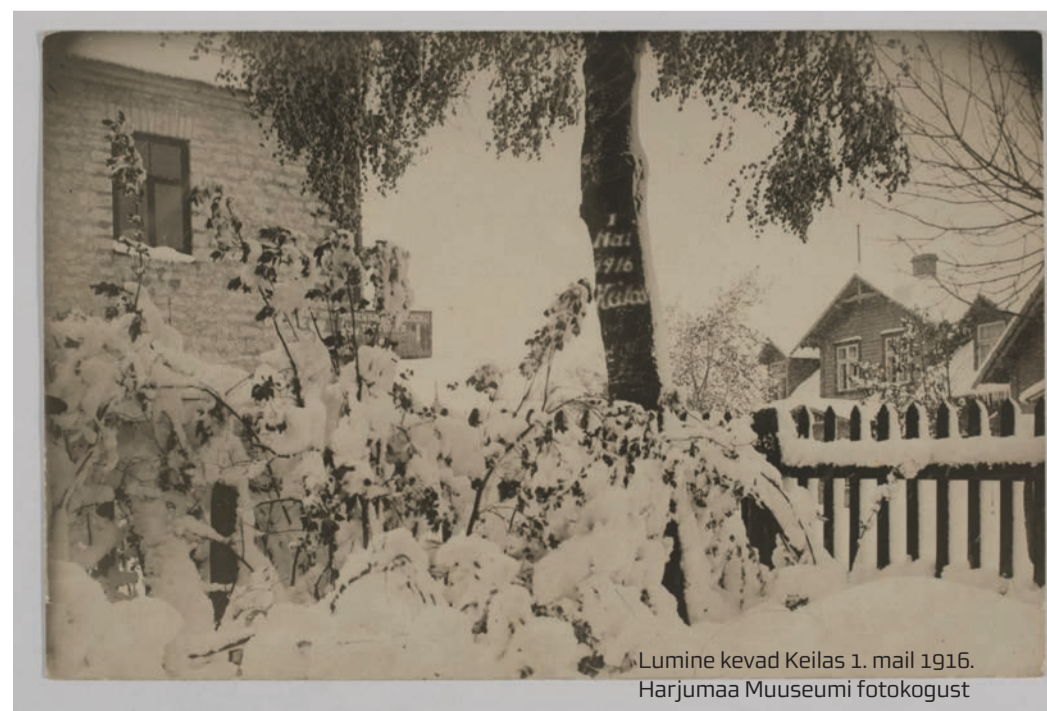
Lumine kevad Keilas 1. mail 1916.