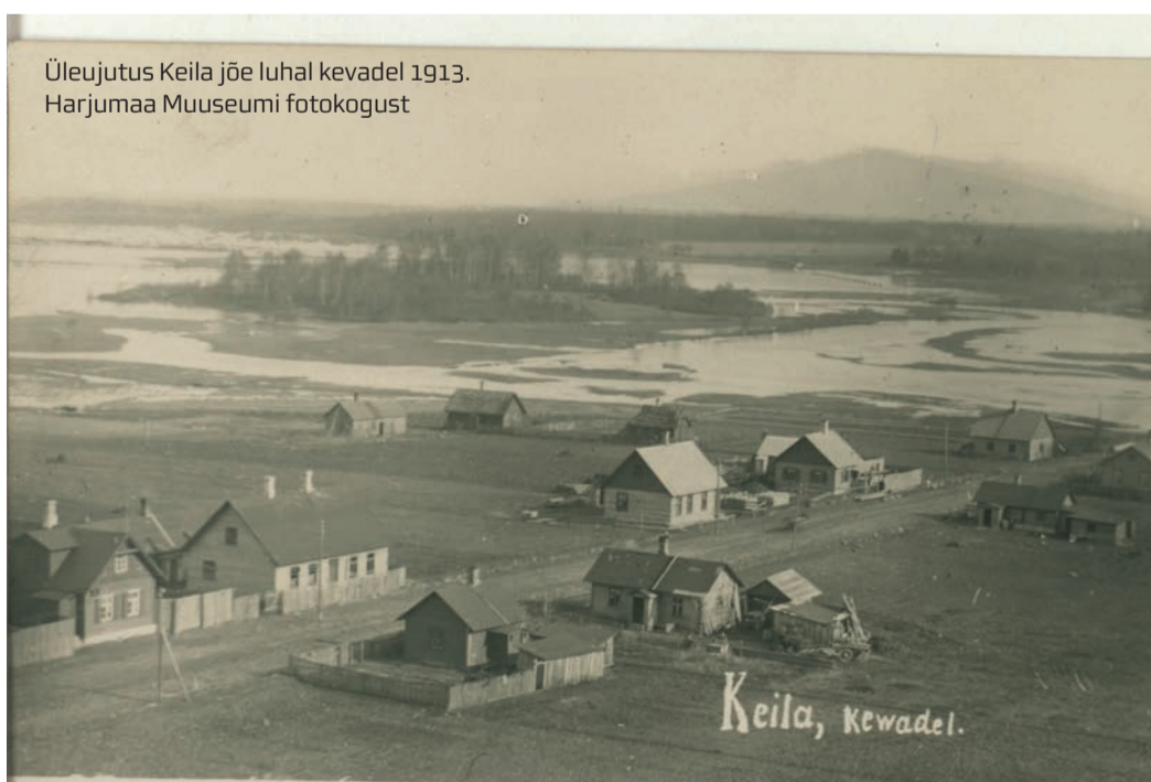
Üleujutus Keila jõe luhal kevadel 1913.