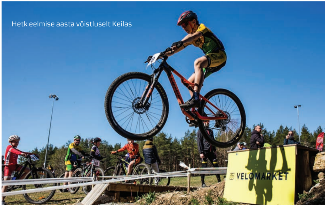
Hetk eelmise aasta võistluselt Keilas