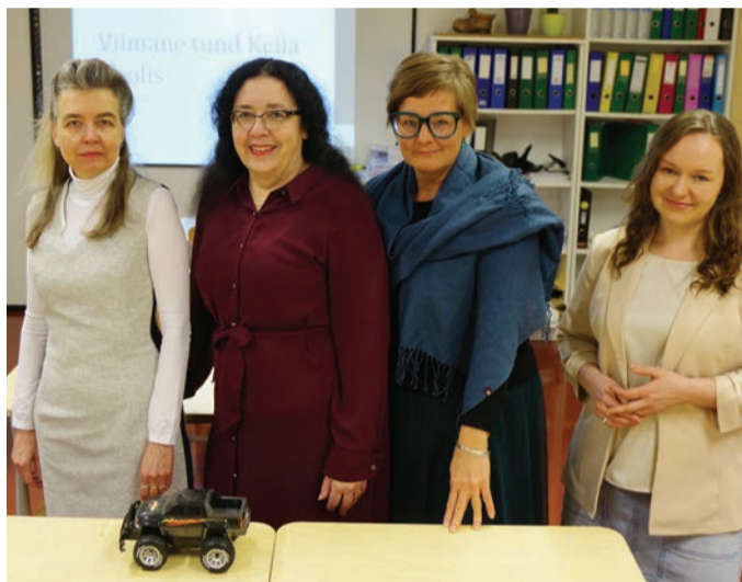
» Gümnaasistide lemmikauto 2024 – eesti keele nelikvedu