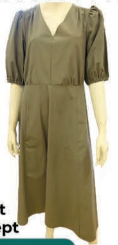
Naiste kleit Soyaconcept