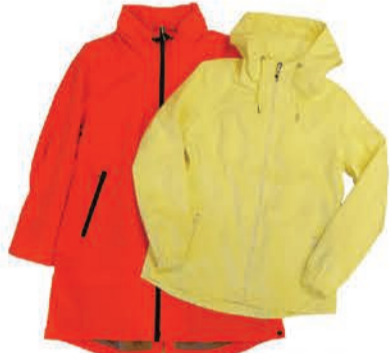
Naiste mantlid ja joped