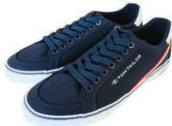
Meeste jalatsid T.Tailor