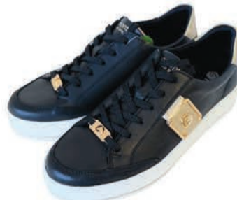
Naiste jalatsid Remonte