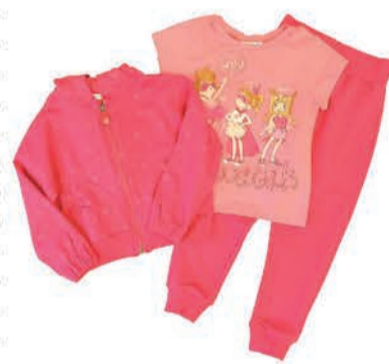
Laste komplekt Mayoral