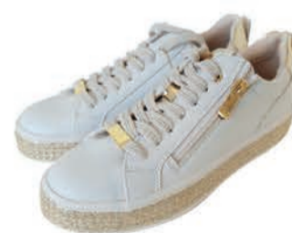
Naiste jalatsid Marco Tozzi