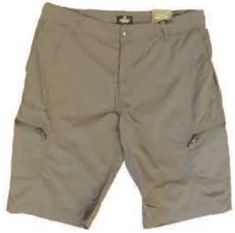
Meeste shortsid Crossfield