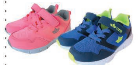
Laste jalatsid Lico