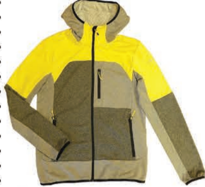
Meeste dressipluus Icepeak