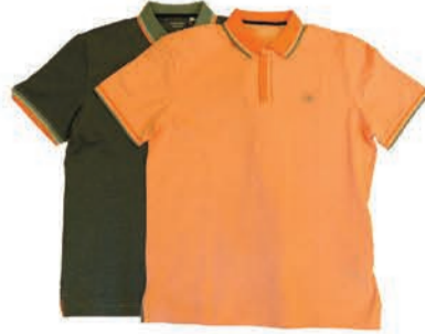
Meeste polosärk Tom Tailor