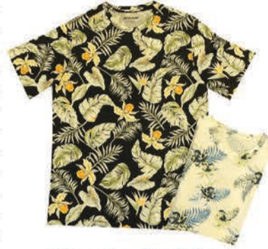
Meeste T-särk Jack & Jones