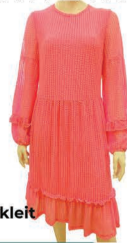
Naiste kleit Only