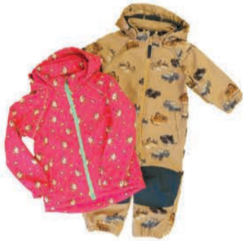
Laste joped ja kombinesoonid