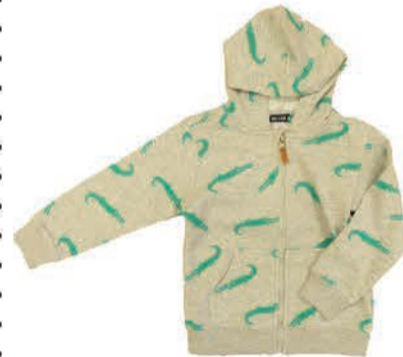
Laste dressipluus Blue Seven