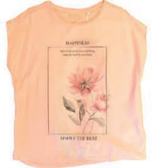
Naiste plus Blue Seven