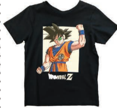
Laste T-särk Name It