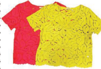
Naiste plus M.X.O.