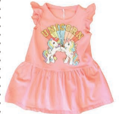
Laste kleit Name It